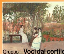
Gruppo Voci dal cortile

Vi aspettiamo numerose... per informazioni non esitate a contattarci...!!!!